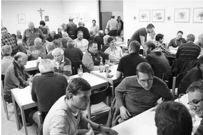
Rekordteilnahme beim 8. Schafkopfturnier der Pfarrei Kirchdorf. Eng ging's zwar zu, aber die Stimmung war prächtig.