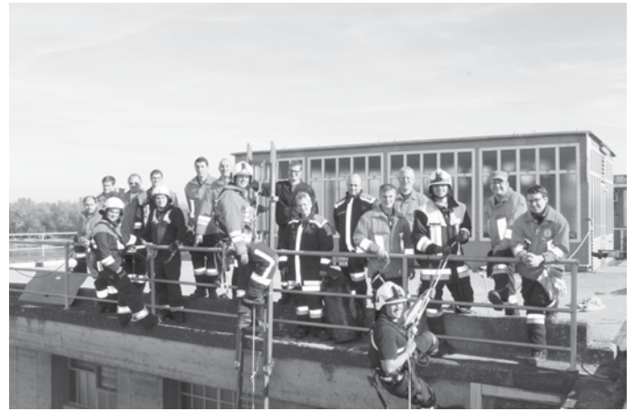
Die Teilnehmer und Ausbilder am Grenzkraftwerk in Kirchdorf a. Inn

eigenen Feuerwehren umzusetzen und wünschten stets ein unfallfreies Arbeiten mit dem Gerätesatz Absturzsicherung.