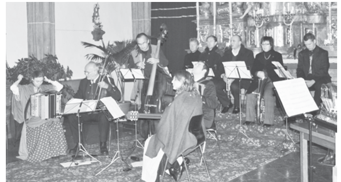
Gruppen aus dem vergangenen Adventsingen.