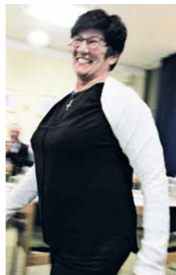
Selbst als Armauflage tut die Unterhose ihre Dienste.