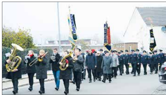
Angeführt von den Kirchdorfer Musikanten zogen Bürgermeister, Vereine und Gemeinderäte von der Kirche bis zur Gemeinde und wieder zurück

Enorm wichtig sei, forderte der Bürgermeister, dass Volksverhetzung und Ressentiments, Antisemitismus, nationale Egoismen und die Bereitschaft zur Gewaltanwendung in Europa niemals wieder die Oberhand gewinnen dürfen. An die bittere, leidvolle Lehre aus der Vergangenheit soll man sich nicht nur am Volkstrauertag erinnern. Den Toten von Krieg und Gewaltherrschaft wird an diesem Tag jedoch im Besonderen gedacht. Kriegsgräber und Gedenkstätten sind die stummen Mahner dieses millionenfachen, grausamen Elends, betonte Springer und ging auf den Artikel I im Grundgesetz ein, in dem es heißt, dass die Würde des Menschen unantastbar ist. Dieses kühne Versprechen der Verfassung lässt kein Vielleicht, kein Abwägen und keine Ausnahme zu, versicherte Springer. Und die Kernaussage und Einsicht, dass Frieden keine Selbstverständlichkeit ist, gilt es weiterzugeben an jene, auf die es morgen ankommt, schloss der Bürgermeister und legte im Gedenken an alle Verstorbenen, Gefallenen und Vermissten aus den beiden Weltkriegen einen Kranz nieder.