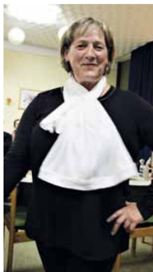
Auch als Wärmeschal in kalter Jahreszeit lässt sich das gute Stück nutzen.