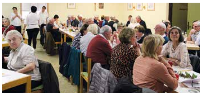
Es war viel Betrieb los im Pfarrzentrum.