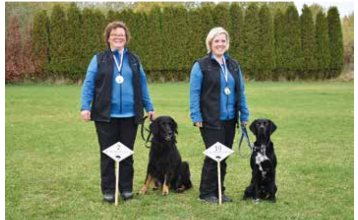
Autorin: Claudia Sattlecker

Vielen Dank an den HSV Hirschau für die hervorragende Organisation dieser Meisterschaft und an unsere Landwirte, die uns in Kirchdorf das Trainingsgelände zur Verfügung gestellt haben.