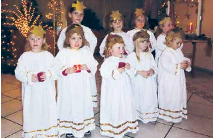
Die putzigen Engerl nach ihrem Lichtertanz

Frauenbund eröffnet den Reigen der Vorweihnachtsfeiern