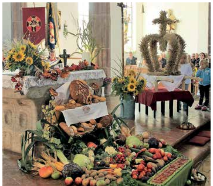
Der Volksaltar, der zum Erntedankaltar umgewandelt worden war, und die neue Erntekrone.