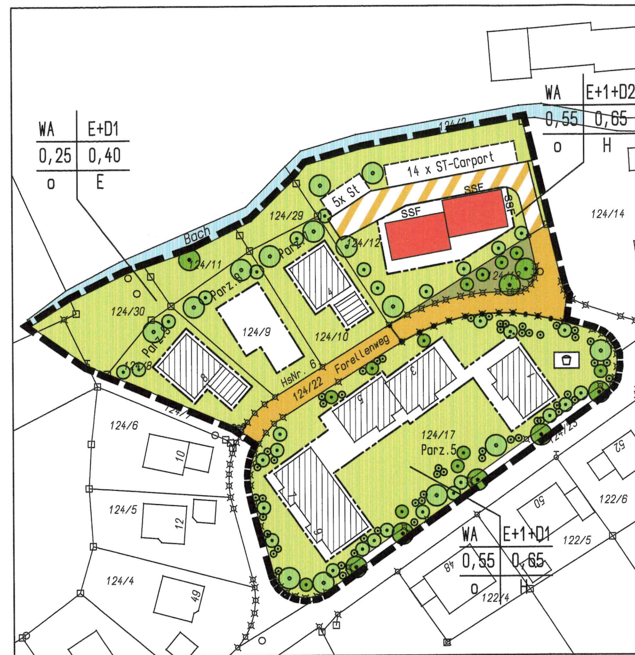
Bebauungsplan neuer Zustand Deckblatt Nr.3 M 1:1000