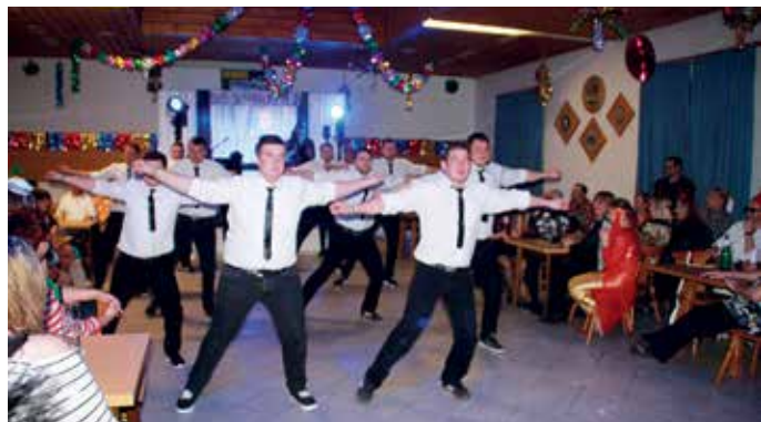
Die Männergarde von „Hund und Sau“ sorgten für Stimmung

die Tanzenden ins Schwitzen brachten. Alle waren mit dabei, als sich eine lange Polonaise durch das Schützenhaus schlängelte und nicht nur beim Bobfahrer-Lied tanzten und klatschten die Gäste kräftig mit. Mit begeistertem Applaus wurden die Aufführungen der Tanzgruppe „Sensation“ aus Julbach ebenso belohnt wie die Männergarde vom Ganzjahresfaschingsverein „Hund und Sau“.