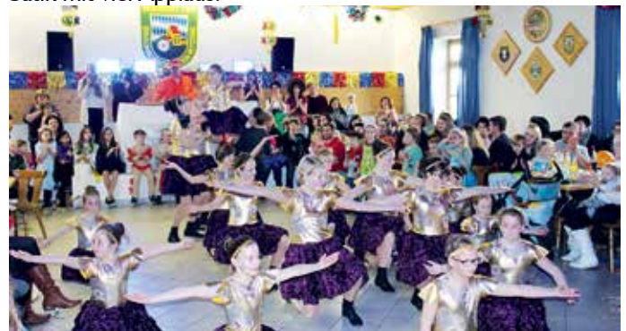
Prinzengarde und Showtanzgruppe ernteten für ihre Auftritte viel Applaus