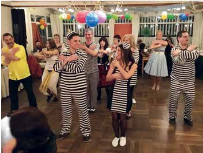
Diese Sträflinge hatten für einen Abend Freigang Monika Hopfenwieser