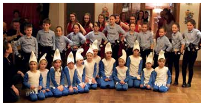
Die Freed Desires präsentierten ihr Können beim TSV-Fasching