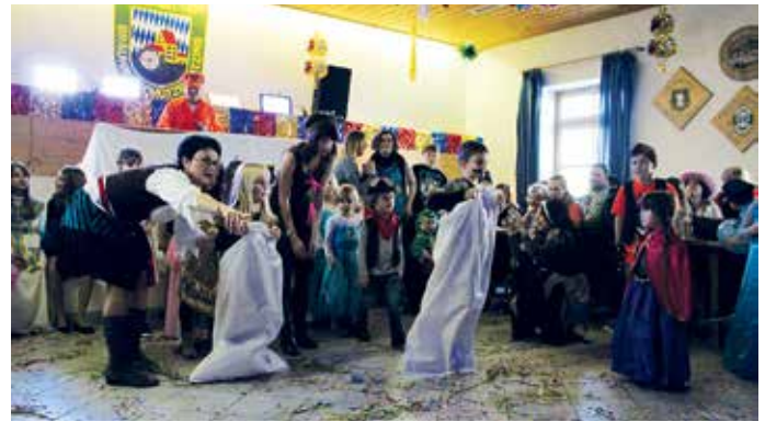
Beim Sackhüpfen hatten die bunten Maschkera viel Spaß