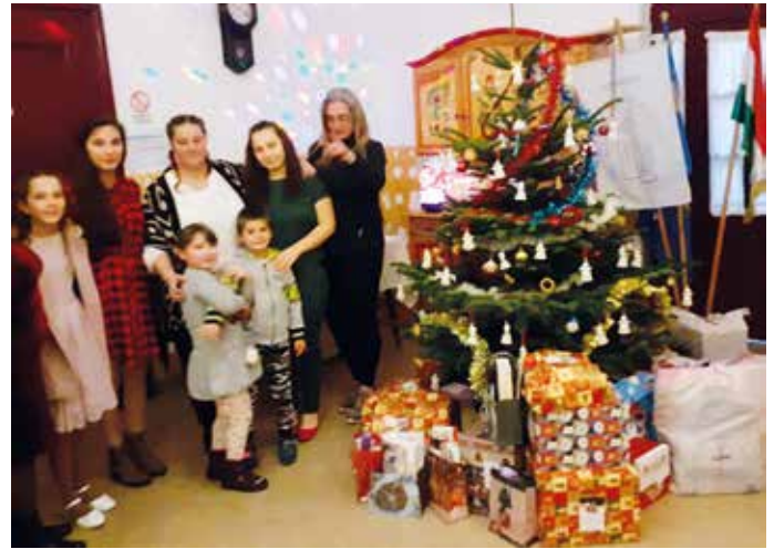
Fotos aus Săcueni/ Dezember 2020