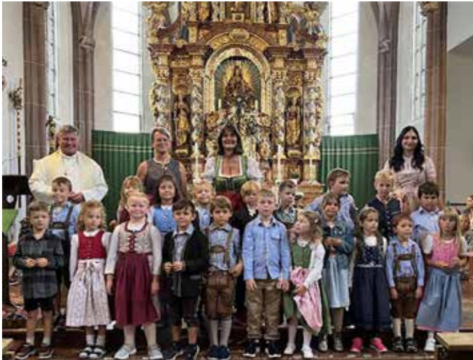
Rauswurf am letzten Tag:

Bei Eis, Saft oder Sekt wurde das Kindergartenjahr noch einmal Revue passiert, und über so manche Anekdoten der Kinder herzlich gelacht.